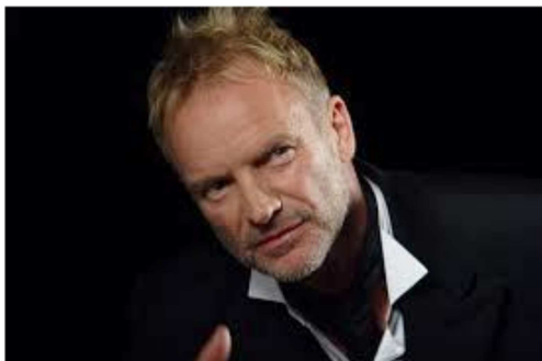
Il cantante Sting

L'Amministrazione approva lo schema di "transazione e tacitazione del contenzioso" che accontenta sia il cantante che gli enti pubblici coinvolti