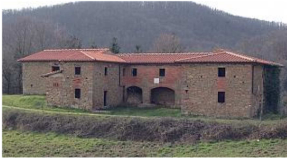
Il casolare dei Cavicchi a Pian d'Albero

Il provvedimento dei vigili urbani fissa le deroghe per i mezzi a motore, dopo il problema dei fuoristrada che si erano persi durante un raduno