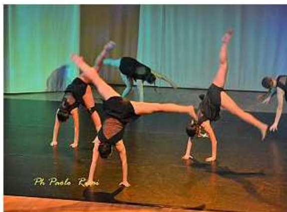
Un momento di Valdarno Dance edizione 2020