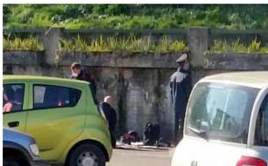
Il materiale trovato nell'auto

Nella vettura esaminata questa mattina c'era materiale per far saltare in aria i bancomat. L'involucro è stato fatto brillare dagli artificieri