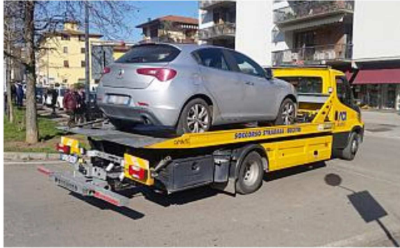
L'auto viene portata via dopo i controlli dei Carabinieri

Conclusa l'operazione delle forze dell'ordine in via Petrarca. Impegnati anche gli artificieri per esaminare il materiale rinvenuto nella vettura